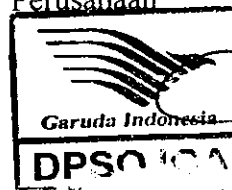
( Akbar Wicaksono )