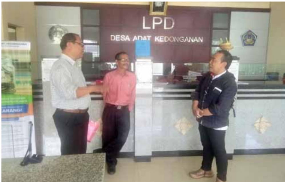
Foto 4.1 Suasana Kerja LPD Kedonganan pada Bulkan Maret 2020

di pedesaan. Meningkatkan daya beli, memperlancar lalu lintas pembayaran dan peredaran uang di desa, serta melestarikan budaya Hindu, adat istiadat dan agama” (Wawancara dengan I Ketut Madra, 7 Maret 2020).