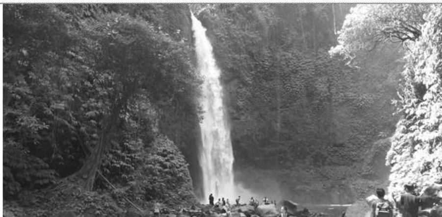
Foto 2. Air Terjun Nungnung