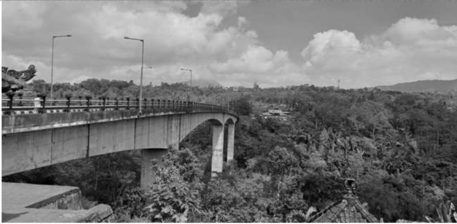
Foto 1. Tukad Bangkung