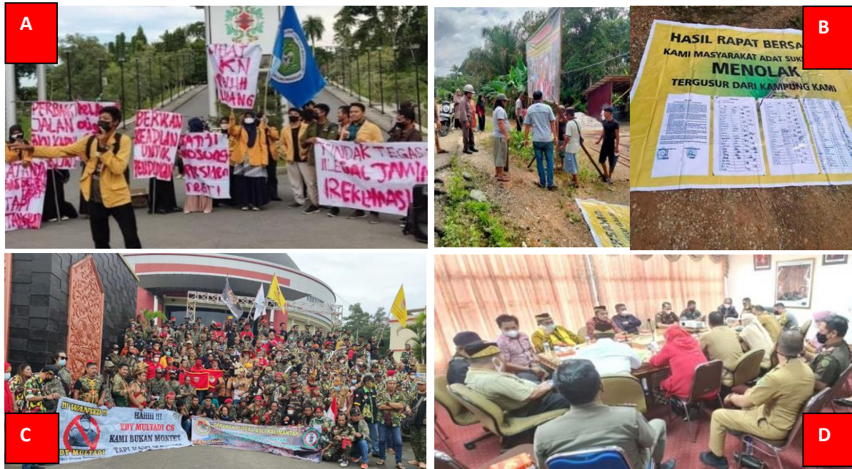
Gambar 1. Demo Mahasiswa dan Masyarakat Adat Terkait Pembangunan IKN

Pemberdayaan masyarakat penting agar konflik sosial tidak terjadi lagi seperti di Sampit karena masalah ekonomi, sosial, dan budaya (17)(18)(19)(20). Masyarakat harus nyaman melaksanakan kegiatan dan fungsi sosialnya serta diberdayakan dan tidak terpinggirkan akibat IKN ke depan (21)(22)(9). Ada gap antara program pemerintah dengan harapan masyarakat. Penelitian ini tepat dilakukan sebagai solusi dan cara pemetaan model pemberdayaan masyarakat lokal guna terwujudnya harmoni sosial dan green city tourism di IKN.