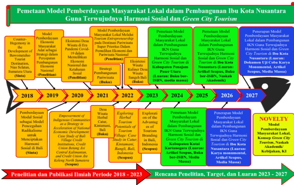
Gambar 2. Roadmap Penelitian Fundamental

Roadmap penelitian 5 tahun ke depan, penelitian, dan publikasi tim peneliti terlihat pada Gambar 1 berikut ini.